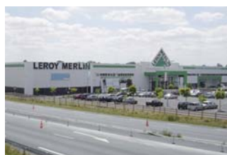
Leroy Merlin La Roche-sur-Yon