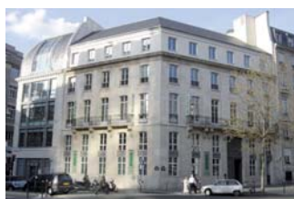
Espace Mobalpa Paris 3000 m 2 d'exposition

Quelques uns des projets sur lesquels nous avons travaillé :