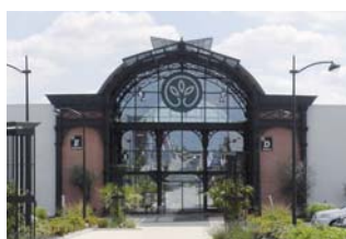
Gamm vert La Roche-sur-Yon