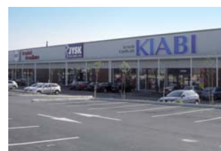
Ensemble commercial Auxerre